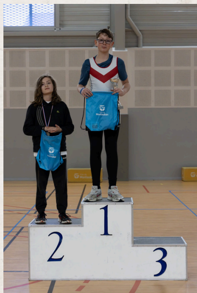
Martin 2ème J13